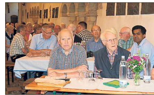
Bei Wein und Brot waren die Mitglieder zur Versammlung in der Kirche zusammengekommen.