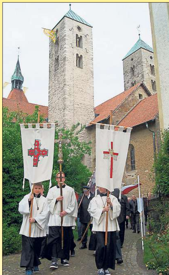
Die Prozession zieht am Sonntag um 8.45 Uhr aus. In diesem Jahr wird das Krüßingfest erstmals ökumenisch gefeiert.