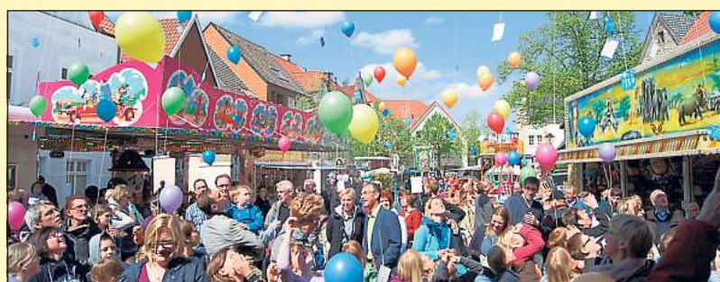
Vor dem Start der Kirmes am Samstag sind erstmal die Kinder dran: Beim Luftballonwettbewerb gibt's schöne Preise zu gewinnen.

Den Abschluss des Krüßingfests bilden am Montag der Familientag auf der Kirmes ab 15 Uhr sowie der Vortrag zum Thema „Christen gestalten das Land“ von der Ministerpräsidentin a.D. Christine Lieberknecht aus Erfurt in der Landvolkshochschule.